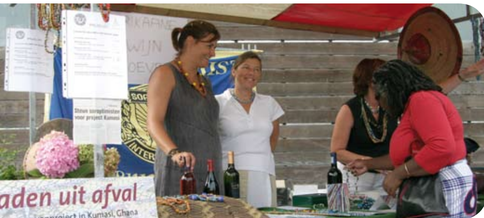
Soroptimistclub Almere in actie voor Kumasi op de Afrikadag 2006.

van kralen uit glas. Maar ze hebben geen geld voor een oven en voor het inkopen van glas. Het susu systeem is te kleinschalig om hier een oplossing te bieden. Een lening uit een Almeers microkredietfonds via de Rural Bank zou wel een oplossing voor ze kunnen zijn. SamenWerk wacht de eindrapportage van het onderzoek in Kumasi in spanning af.