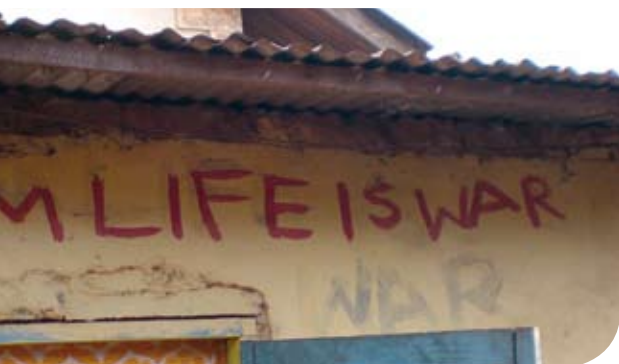
Veelzeggende graffiti boven de ingang van het straatkinderen opvanghuis.

middelen een bestaan op kan bouwen en dat met een enorme kracht en hoop te blijven doen. Ik ben daarom van mening dat de mogelijkheden vooral zitten in kleine projecten die samen met mensen uit bijvoorbeeld Pakistan, de Filippijnen, of hier in Ghana worden opgezet en uitgevoerd.”