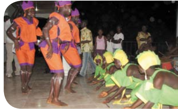
Leerlingen van de Parkoso school dansen, zingen en drummen tijdens het bezoek van de Almeerse delegatie.