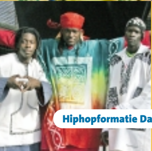
Hiphopformatie Daara J uit Dakar