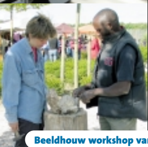
Beeldhouw workshop van Huis van Steen