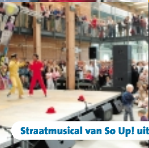
Straatmusical van So Up! uit Soweto