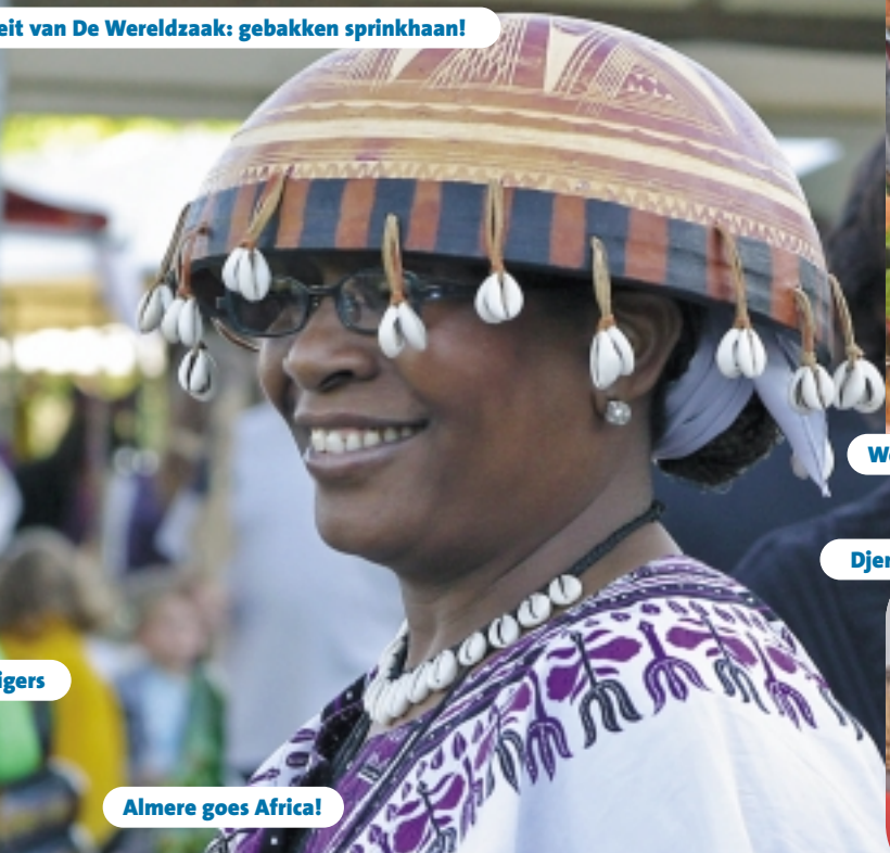
Almere goes Africa!