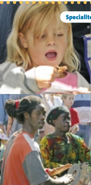
Specialiteit van De Wereldzaak: gebakken sprinkhaan!