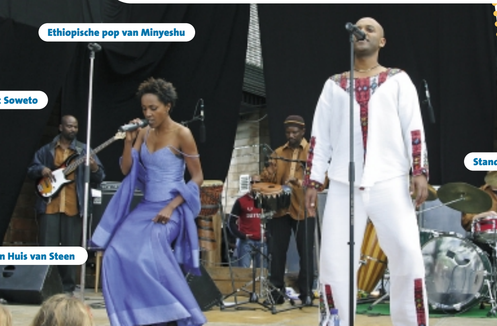
Ethiopische pop van Minyeshu

De organisatoren (stichting SamenWerk, CKV Almere en natuurcentrum Het Eksternest) bedanken alle vrijwilligers, sponsors, ons publiek en de weergoden voor een zeer geslaagde Afrikadag, die bewijst dat dit evenement een vaste plaats heeft verdiend op de Almeerse cultuuragenda.