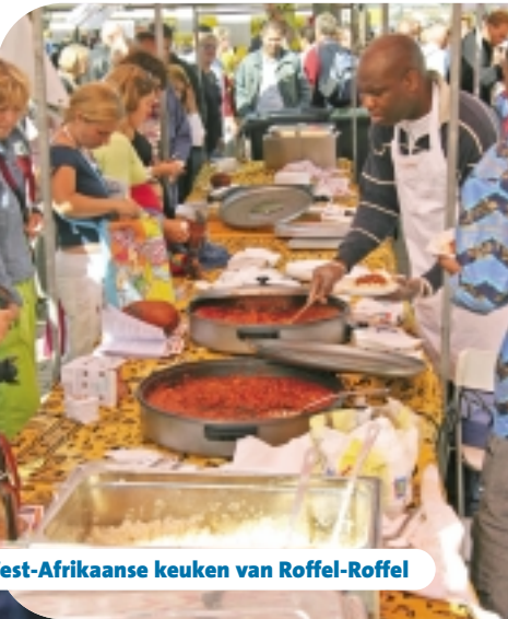
West-Afrikaanse keuken van Roffel-Roffel