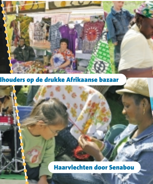
Haarvlechten door Senabou