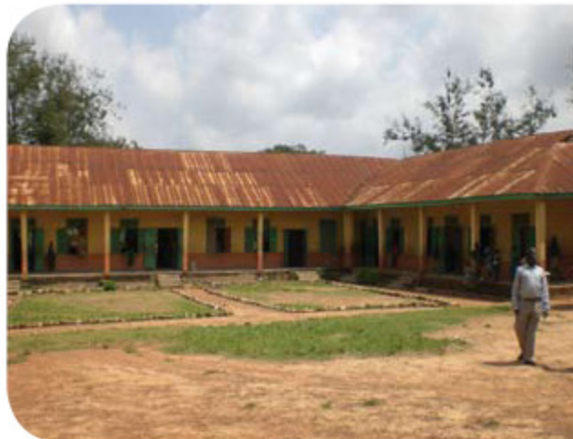
Ohwin school in het stadsdeel Bantama.

Onlangs is in Ghana het onderwijs op overheidsscholen gratis geworden en daardoor kiezen veel ouders van kinderen op particuliere scholen nu ook voor het openbare onderwijs. Dit heeft tot gevolg dat deze scholen zo overbevolkt raken dat ze in wisseldienst moeten gaan draaien. Een deel van de leerlingen heeft 's morgens les en de andere helft 's middags, en dan nog is er een nijpend gebrek aan lesruimte. Zo ook op de drie scholen die SamenWerk de komende tijd gaat ondersteunen.